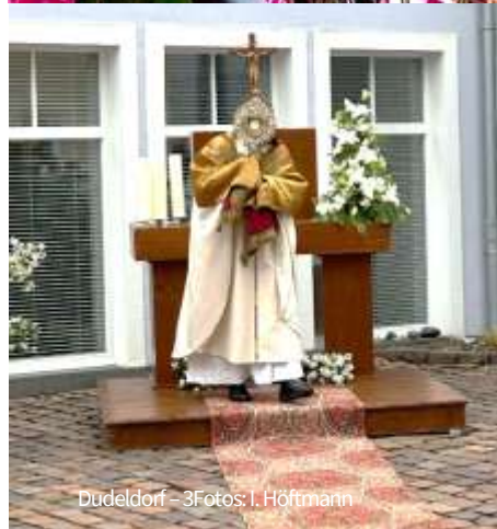
Dudeldorf - 3Fotos: I. Höftmann

Weitere Bilder auf www.pfarrei-speicher.de